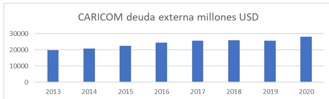
Gráfico 2. Deuda externa de CARICOM